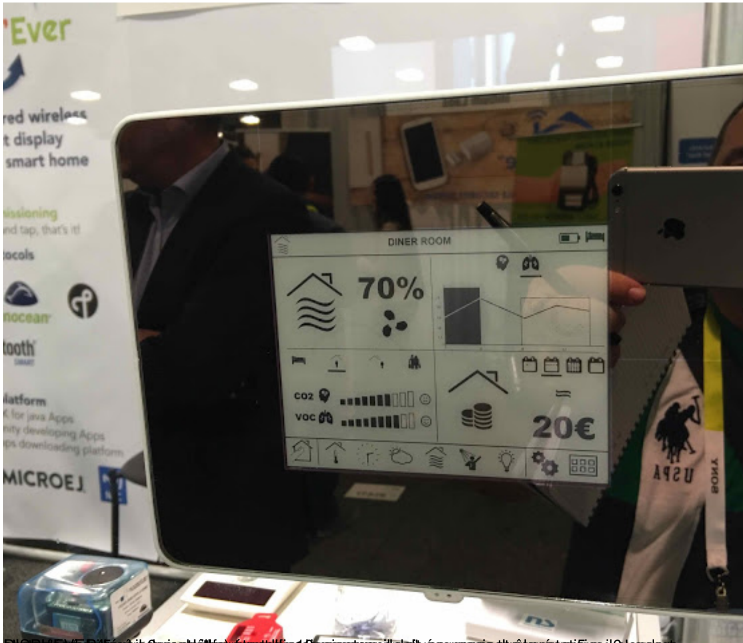
Smart Home (le plus simple à installer) et un écran de contrôle de la consommation d'énergie. Les vendeurs

Mercredi, 13 Janvier 2016 13:00 - Mis à jour Mardi, 12 Janvier 2016 21:37