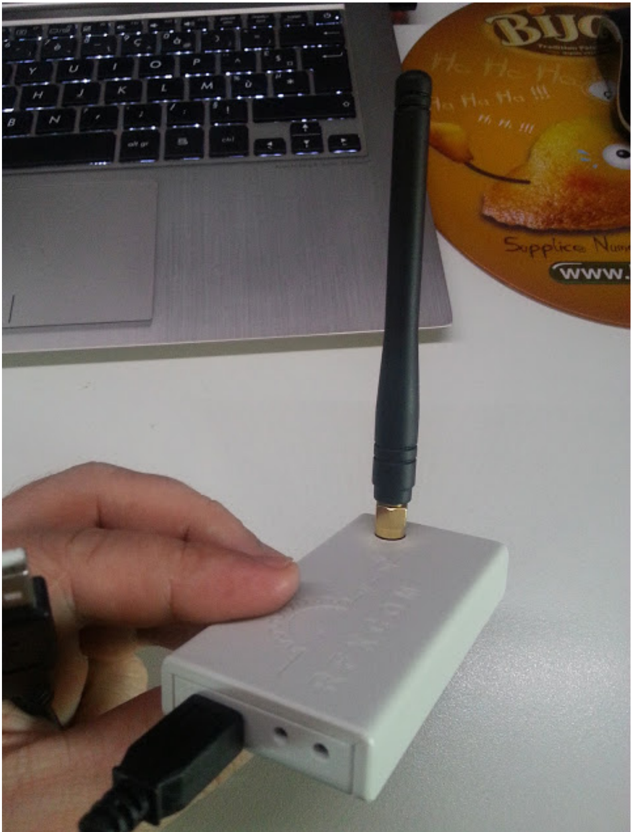
Figure 16-11: RFXtrx 433MHz receiver module. This document is a work of the author and is not to be used for any other purpose without the author's permission.

Mercredi, 13 Février 2013 07:00 - Mis à jour Mercredi, 13 Février 2013 19:04