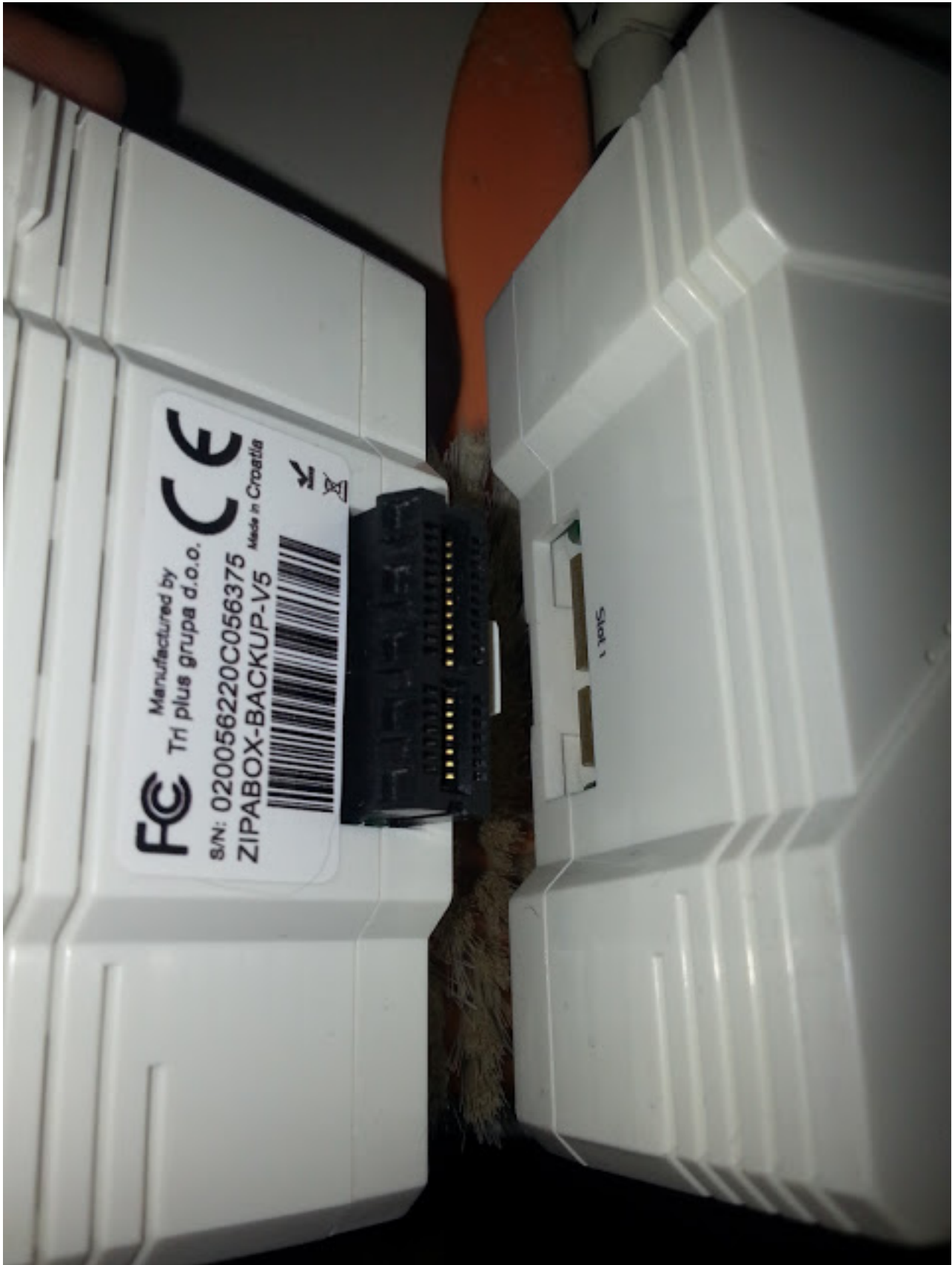
Le module en fonctionnement

Mercredi, 17 Avril 2013 06:00 - Mis à jour Lundi, 15 Avril 2013 22:42