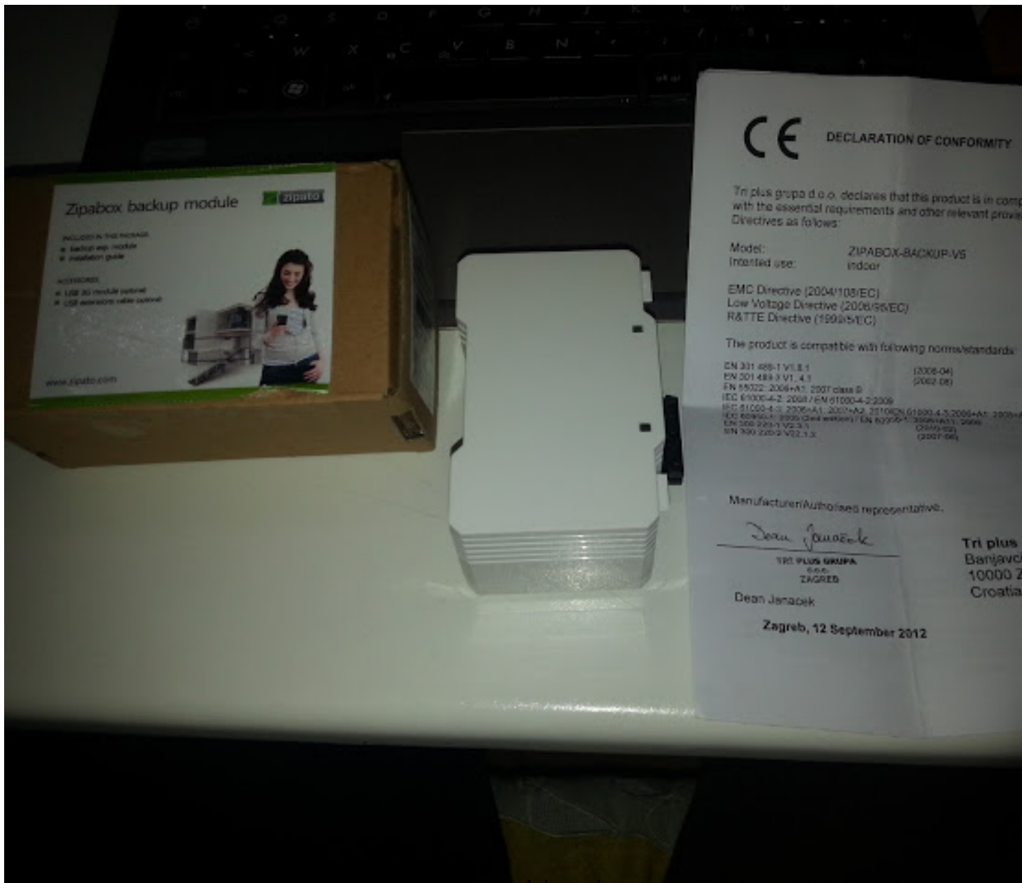
La taille de la taille, le nouveau module mesure deux fois moins que la Zipabox. Il fait 5cm de

Mercredi, 17 Avril 2013 06:00 - Mis à jour Lundi, 15 Avril 2013 22:42